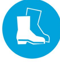
İş ayakkabısı giy