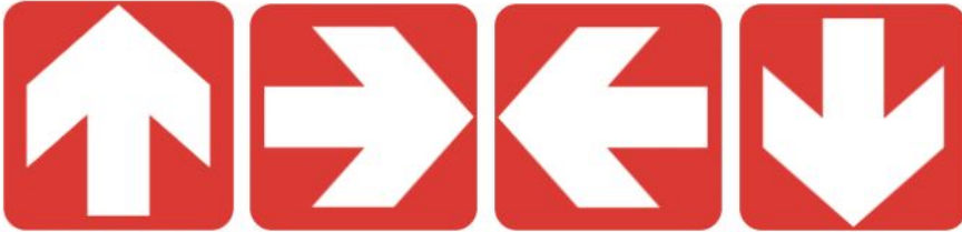
Yönler (Yardımcı bilgi işareti)