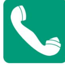
Acil yardım ve ilk yardım telefonu