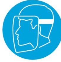
Yüz siperi kullan