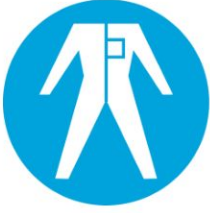
Koruyucu elbise giy