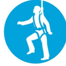
Emniyet kemeri kullan