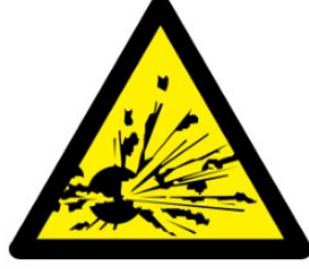
veya Patlayıcı madde