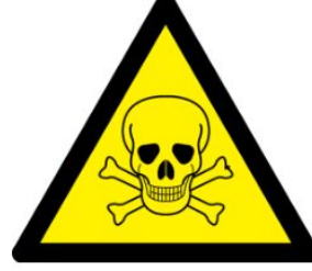
Toksik (Zehirli) madde