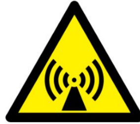
İyonlaştırıcı olmayan radyasyon