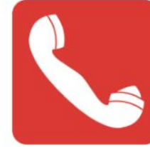
Söndürme Acil Yangın Telefonu