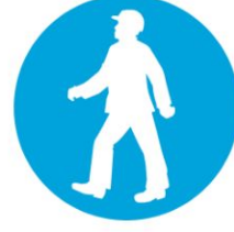
Yaya yolunu kullan