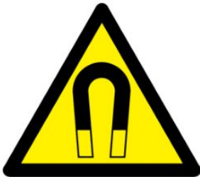
Kuvvetli manyetik alan