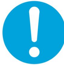
Genel emredici işaret (gerektiğinde başka işaretle birlikte kullanılacaktır)