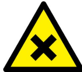
Zararlı veya tahriş edici madde