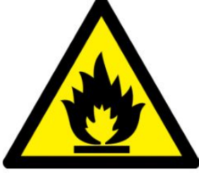
Parlayıcı madde yüksek ısı