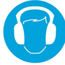
Kulak koruyucu tak